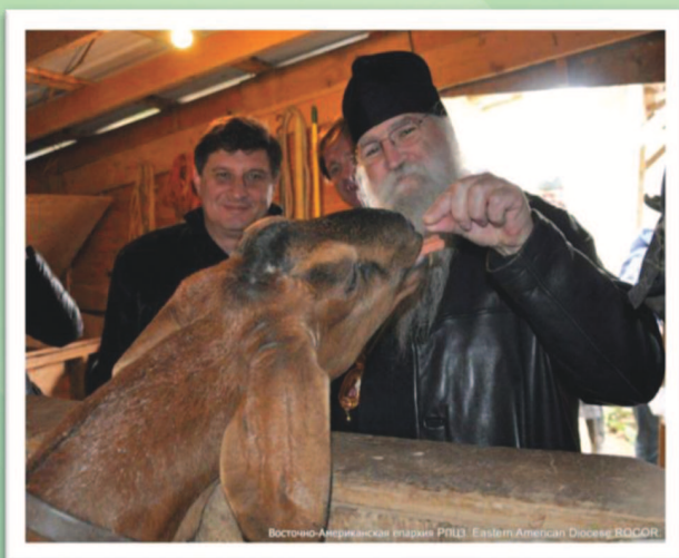
Восточно-Американская Иерархия РПЦЗ. Eastern American Diocese ROCOR

Подробности и другие новости см. на нашем веб-сайте www.fundforassistance.org