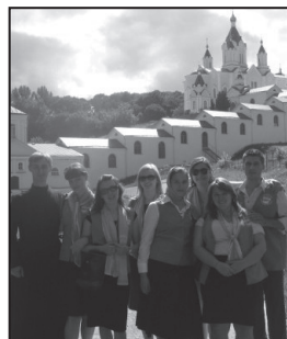
ROCOR group in front of Kurskaya-Korennyaya Pustyn.