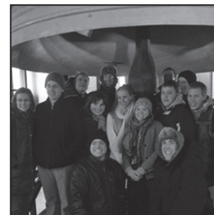
St Heman’s Conference participants pose in the Harvard bell tower in Boston.