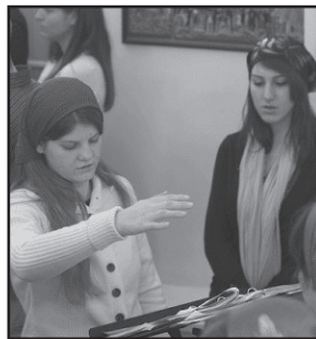
Youth choir directors took turns to conduct at services.